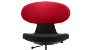
_2 bicolor bicolore